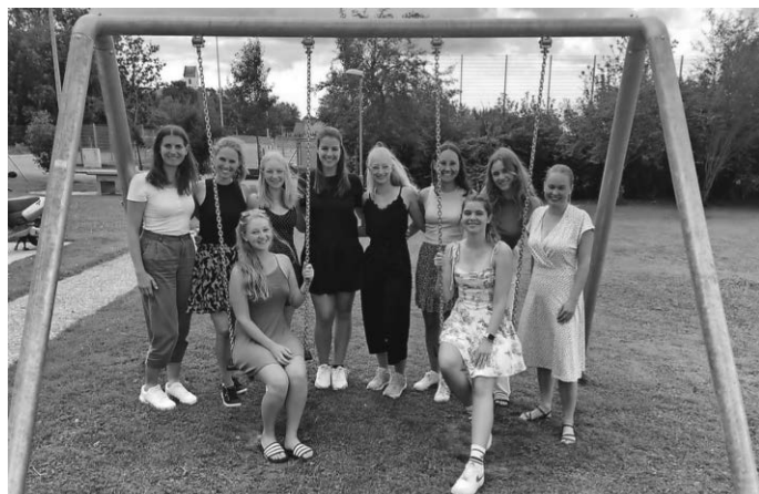
Gratulation an die Spielerinnen der Damen 1 zum Aufstieg in die Bezirksklasse 1!